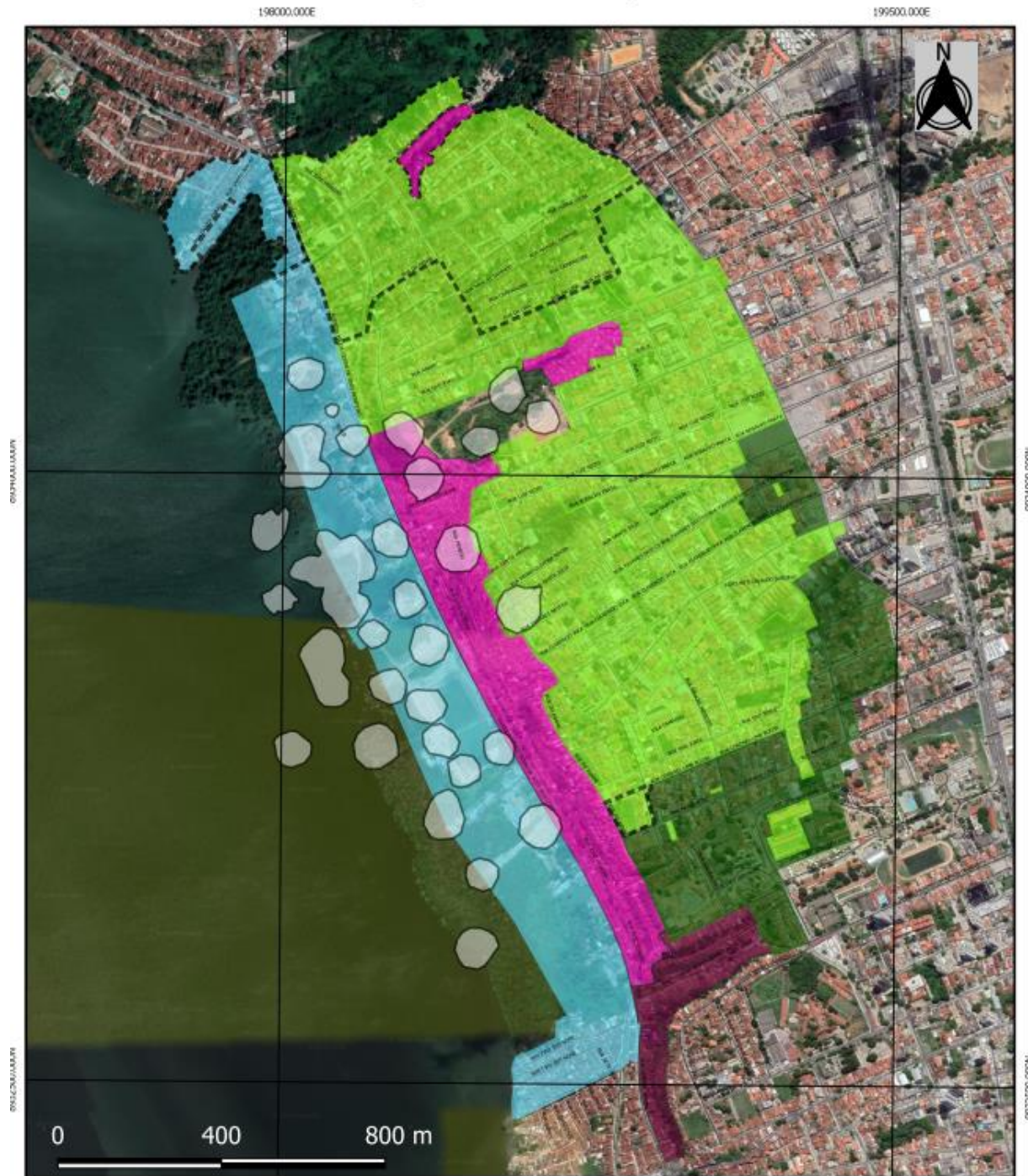
MAPA DE SETORIZAÇÃO DE DANOS E DE LINHAS DE AÇÕES PRIORITÁRIAS